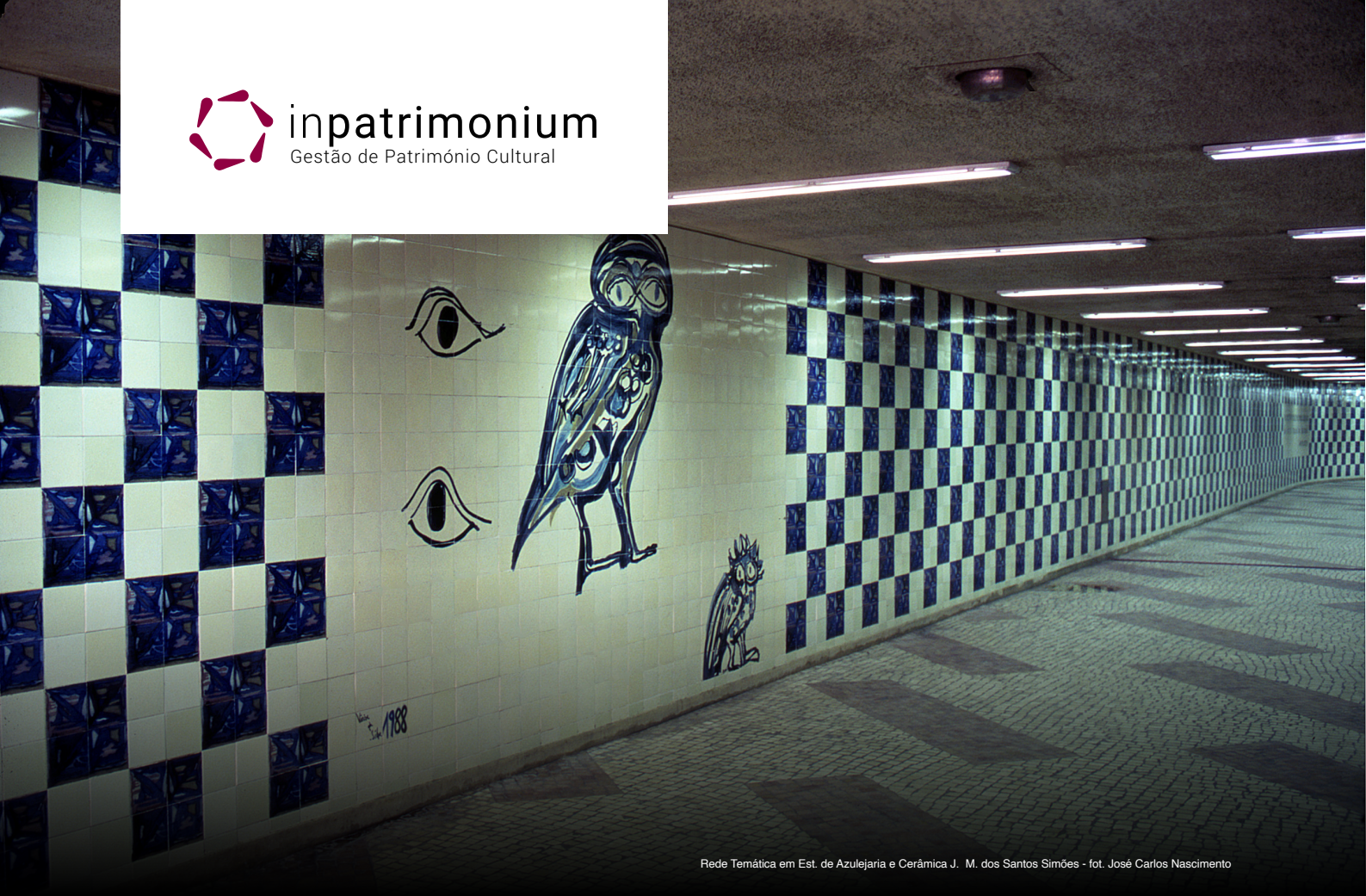
Rede Temática em Est. de Azulejaria e Cerâmica J. M. dos Santos Simões