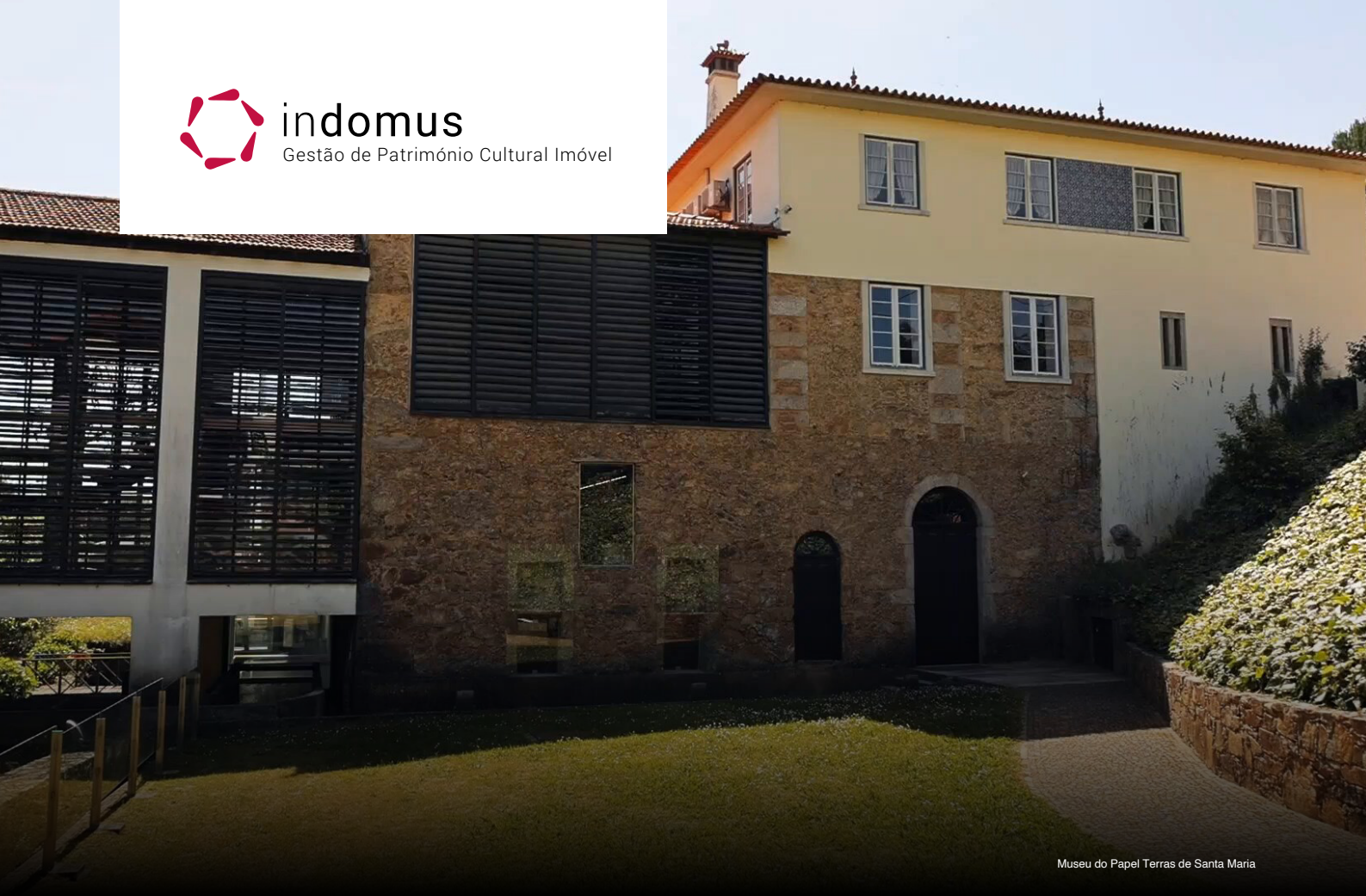
Museu do Papel Terras de Santa Maria