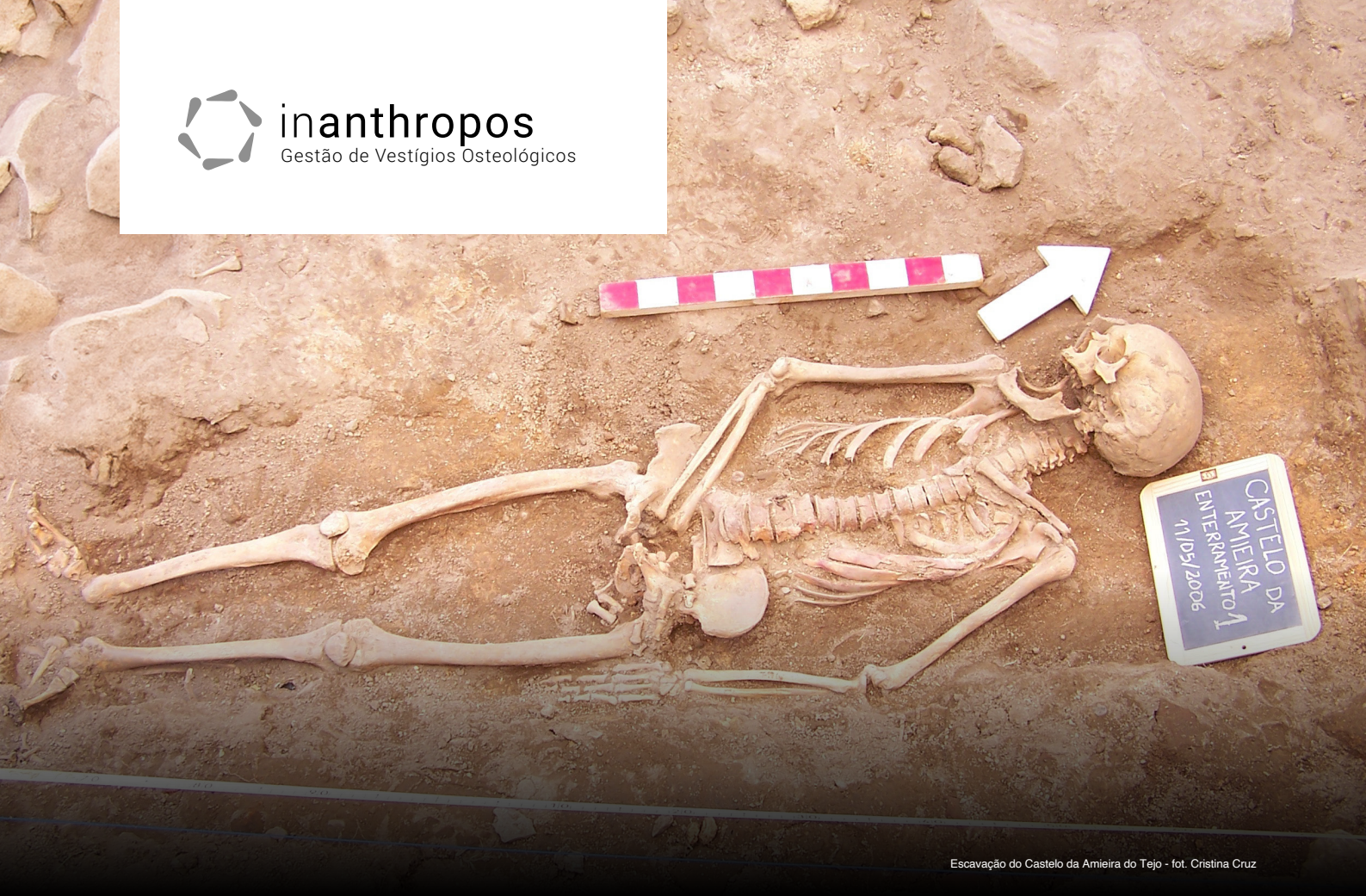
Escavação do Castelo da Amieira do Tejo